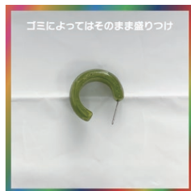
ゴミによってはそのまま盛りつける