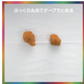
ふっくら丸めてテープでとめる