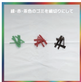
緑・赤・茶色のゴミを細切りにして