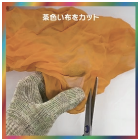
茶色い布をカット