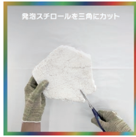
発泡スチロールを三角にカット