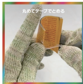
丸めてテープでとめる