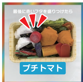
赤いフタを盛りつけたら