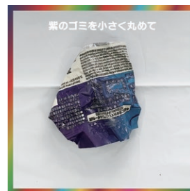
紫のゴミは小さく丸めて