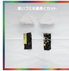
黒いゴミを細長くカット