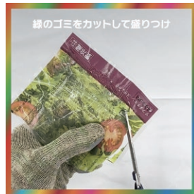
緑のゴミをカットして盛りつける