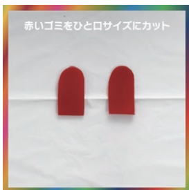
赤いゴミをひと口サイズにカット