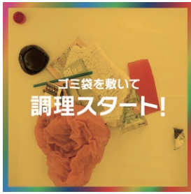
ゴミ袋を敷いて調理スタート!