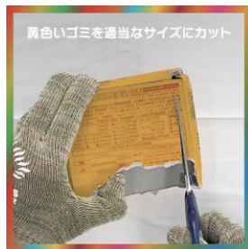
黄色いゴミを適当なサイズにカット